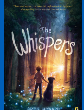
The Whispers por Greg Howard Grados 6-8